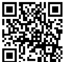
원유철한국사TV 8시간근현대사 강의 듣기

암기 서인+남인의 붕당정치 : 인조반정(서인집권+남인참여) →복발논쟁(효종)→ 기 해예송(현종,서인집권)→ 집 인예송(현종,남인집권)→경신환국(숙종,서인집권:노소분화)→ 기 사환국(남인재집권)→ 갑 술환국(서인집권:노소분화)/남인축출)→ 병 신처분(숙종,노론집권)→ 신 임사화(경종,소론의 노론공격)