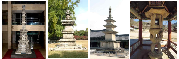
경천사지 10층 석탑 지광국사 현묘탑 불국사 3층 석탑 법주사 쌍사자 석등